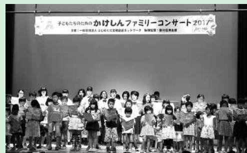
かけしんファミリーコンサート (平成29年7月30日)

少年スポーツ育成のための「かけしん杯中東遠少年野球掛川大会」を共催、「掛川新茶マラソン」「掛川市城下町駅伝競走大会」へも協賛しております。